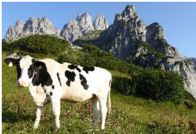
Postkartenidylle vor der Bischofsmütze (Gosaukammumrundung)

Neben den Tageswanderungen waren die Highlights heuer die mehrtägigen Wanderungen in den Triebener Tauern und rund um den Gosaukamm.