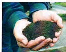
Ein Produkt von der Natur zur Natur